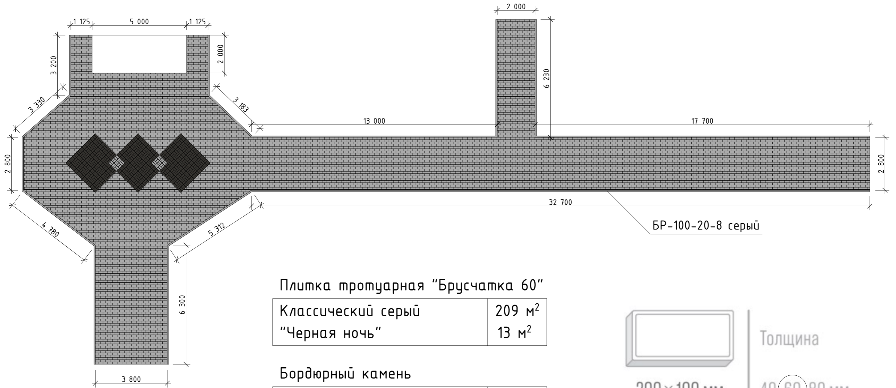
СХЕМА МОЩЕНИЯ ТЕРРИТОРИИ ХОЛДИНГА "АЛТАЙСКИЕ КАРЬЕРЫ" ПО АДРЕСУ: Г. БАРНАУЛ, УЛ. КУЛАГИНА, 12